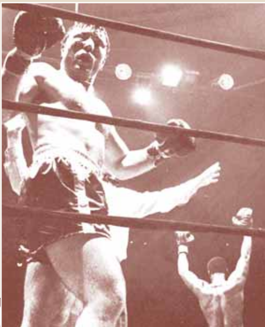
Meč između J. Chuvala i M. Alija u Torontu 23. rujna 1966.

Kanadski državljanin hrvatskog porijekla George - Jure Chuvalo bio je jedan od najuspješniji boksača teške skupine u povijesti svjetskog profesionalnog boksa. Punih 13 godina bio je u vrhu rang-liste najboljih svjetskih teškaša.